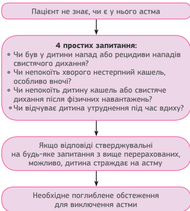
Рис. 1. Оцінка ризику розвитку БА у дитини з АР