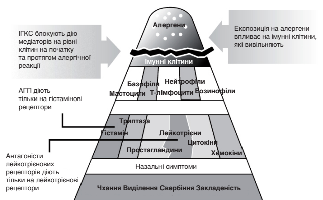
Рис. 2. Механізм дії різних ліків при АР (Meltzer E.O., 1997)